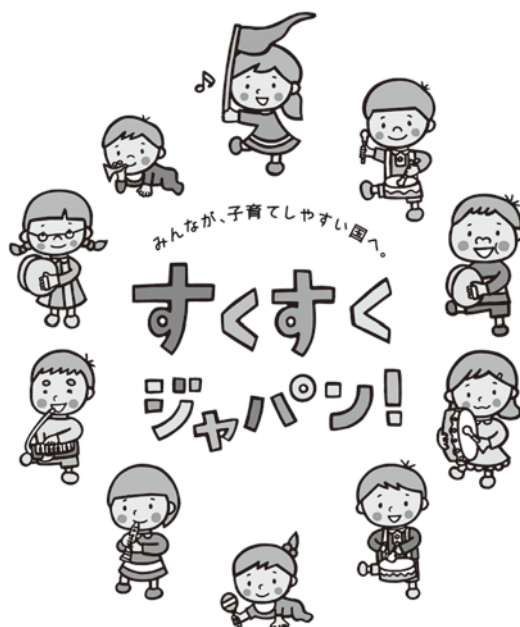
「子ども・子育て支援新制度シンボルマーク」

※「新制度に移行していない」幼稚園等の利用を希望される場合は、直接施設にお問い合わせください。